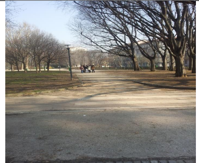
Alcuni gruppi durante le interviste.

Madona, Arzu, Mateo, Vaveri. "INTERVISTA AL PARCO" 1. VIENI OGNI GIORNO DAL PARCO? 2. PREFERISCI QUESTO PARCO O ALTRI TIPI DI PARCHI? 3. VORREBBE ALTRI PARCHI? 4. COSA NE PENSA DEL PARCO? 5. COSA FREQUENTA PIÙ SPESSE DEL PARCO? 6. COSA GLI PIACE DEL PARCO? 7. COSA VORREBBE CAMBIARE DEL PARCO? Risposte: 1. NO, SI, qualche volta, no, no, si per i bambini, no, si, qualche volta, no, si, no. 2. Si questo va bene, questo, questo perché e' vicino da casa, parco sempre, parco Solari, questo va bene. 3. no questo va bene e vicino a casa, No, si più parchi più verde, no, si, no questo va bene, questo va bene, si, no.