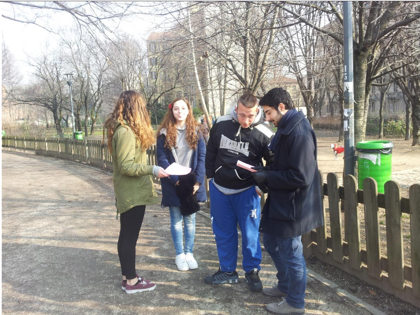
Gli allievi durante l'attività svolta sul campo al Parco Vergani.