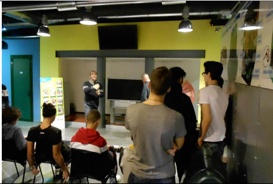
Foto ragazzi durante uscita A2A

Il problema energetico viene contestualizzato nel tessuto cittadino in cui i ragazzi sono inseriti. A tal proposito viene programmata un'uscita didattica presso la "Casa dell'Energia" dell'Azienda A2A. ( http://www.a2a.eu/it/comunicazione/scuole/impianti/casa_energia.html ) Durante tale visita, vengono riproposti mediante laboratori multimediali e tecnico -pratico gli argomenti affrontati in Fase 1 (produzione di energia, energie rinnovabili, fonti di energia, rapporto energia e ambiente). La tematica viene ulteriormente circoscritta mediante la lettura di riviste, siti internet e quotidiani a tiratura locale. Nell'ultima parte viene affrontato il problema dell'impatto ambientale delle attività umane sull'ambiente mediante il calcolo dell'impronta ecologica. Dall'analisi dei dati e di grafici e successivamente calcolando la propria impronta ecologica, i ragazzi hanno sviluppato competenze di cittadinanza attiva nel rispetto e tutela ambientale del proprio contesto urbano.