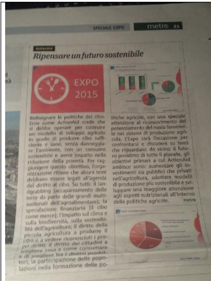
Articolo di giornale letto in classe