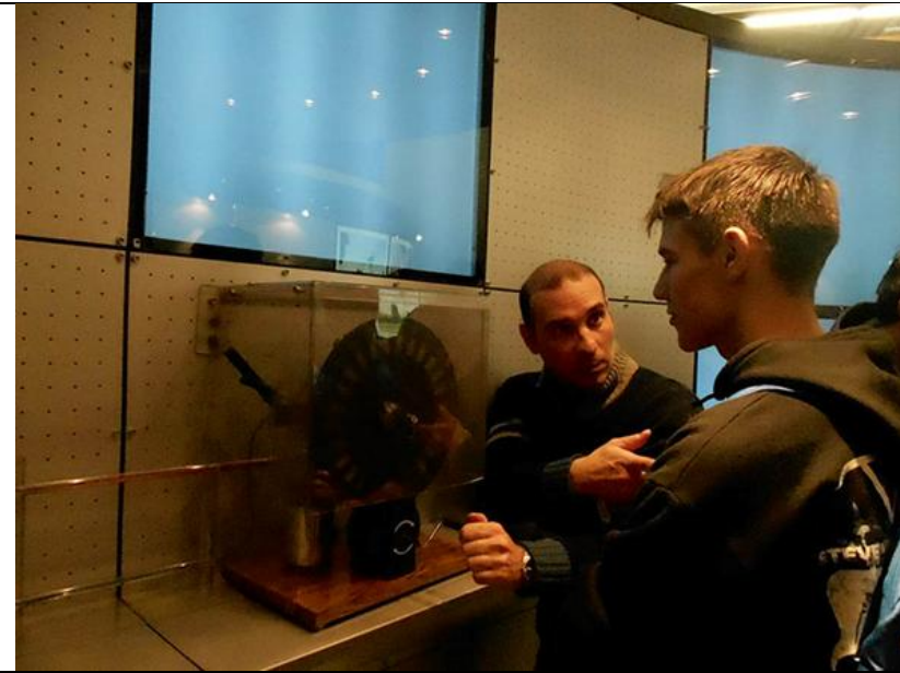
Foto ragazzi durante uscita A2A